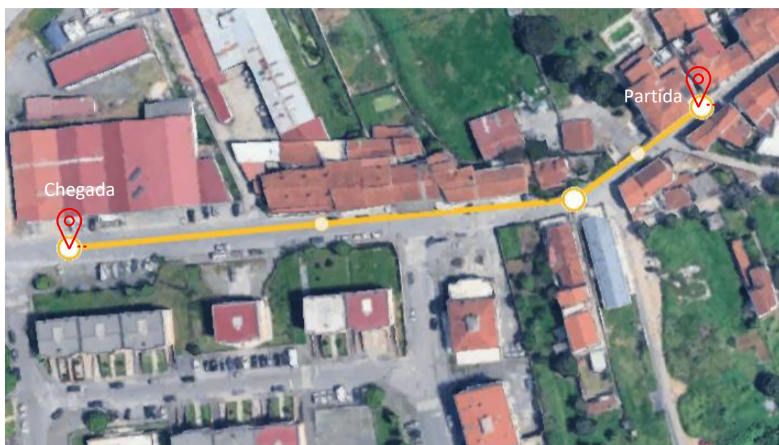
Imagem 3. Percurso Bambis