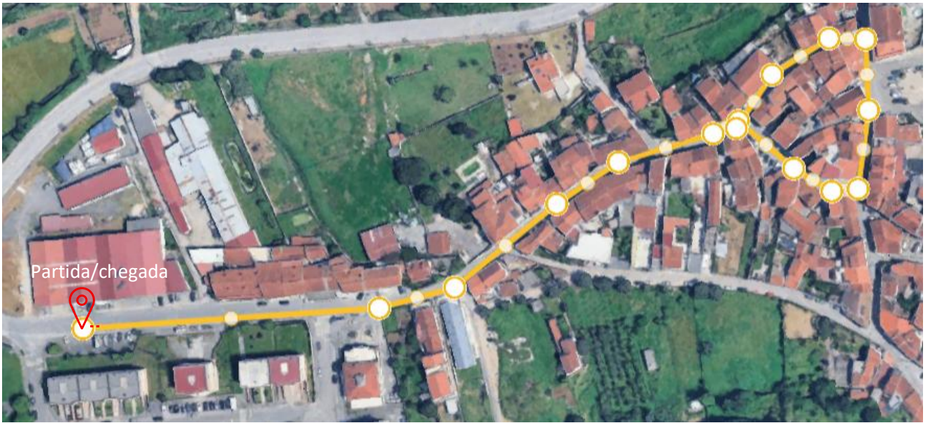
Imagem 4. Percurso Benjamins B