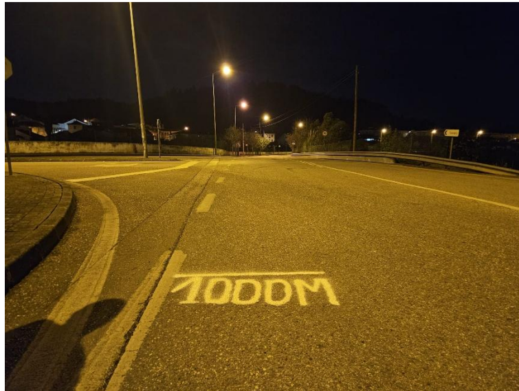
Figura 3 – colocação dos 1000m do percurso da competição