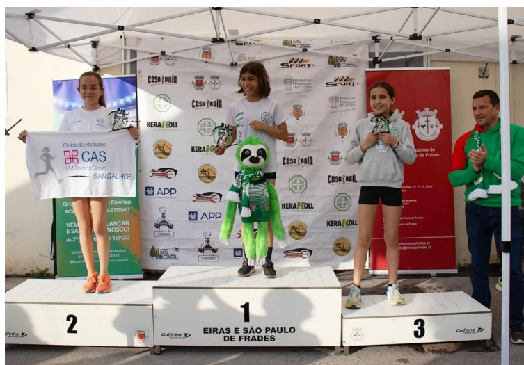
Figura 8 – zona de entrega de prémios, com um dos pódios alusivos ao evento