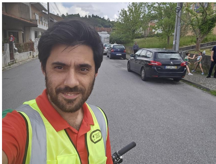
Figura 10 - medidor internacional grau B responsável pelo acompanhamento da competição