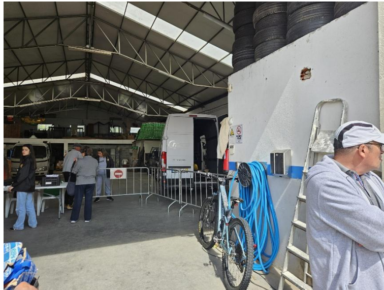
Figura 9 – zona de balneários e WC