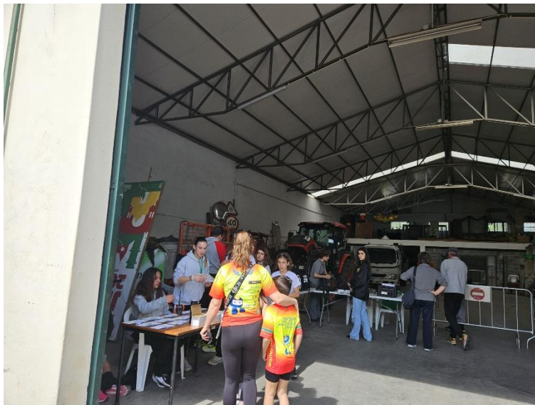
Figura 5 – zona de entrega de dorsais, com casas de banho logo ao lado