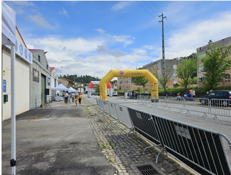
Figura 1 – partida/chegada do percurso da competição (distanciadas de 3,33 metros)