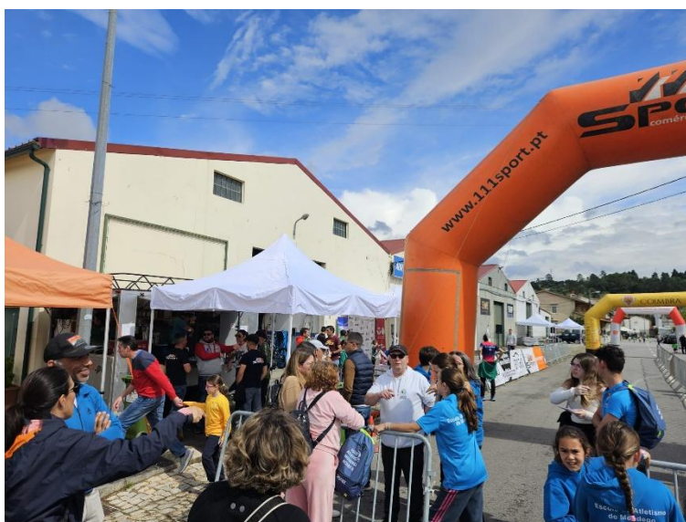
Figura 6 – atletas na câmara de chamada que antecedeu a competição