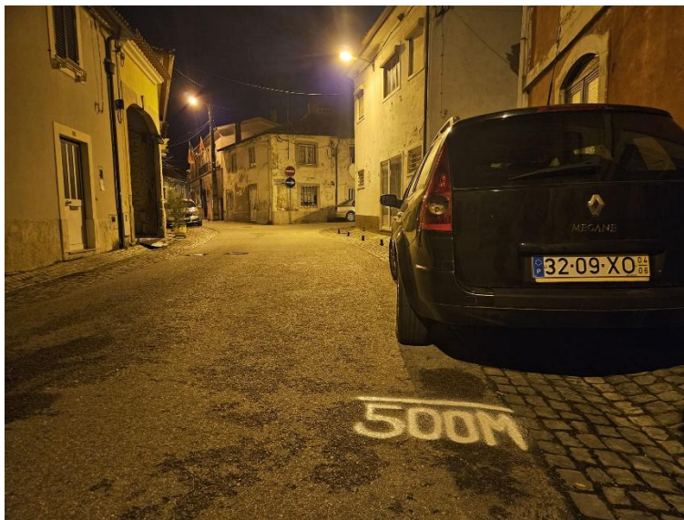
Figura 2 – colocação dos 500m do percurso da competição