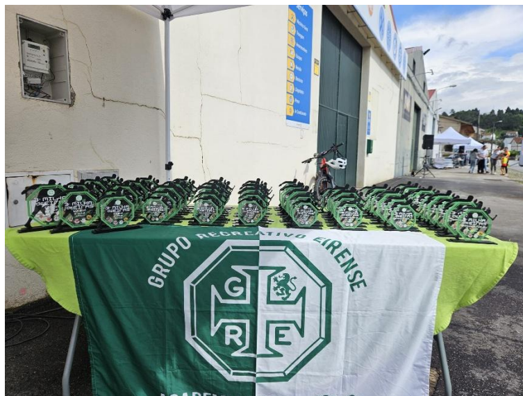
Figura 7 – troféus da competição