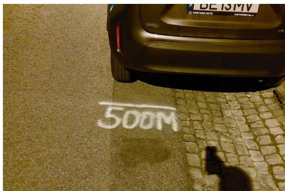
Figura 2 - Zona dos 500 metros