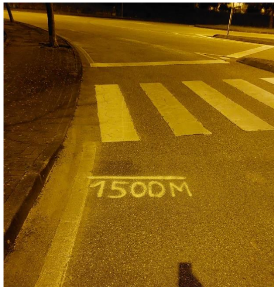
Figura 4 - Zona dos 1500 metros