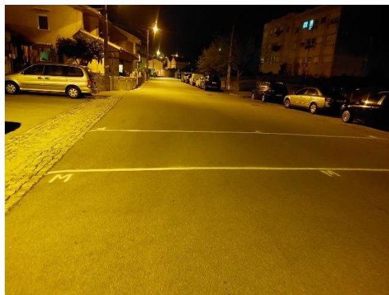
Figura 5 - Zona da meta / chegada